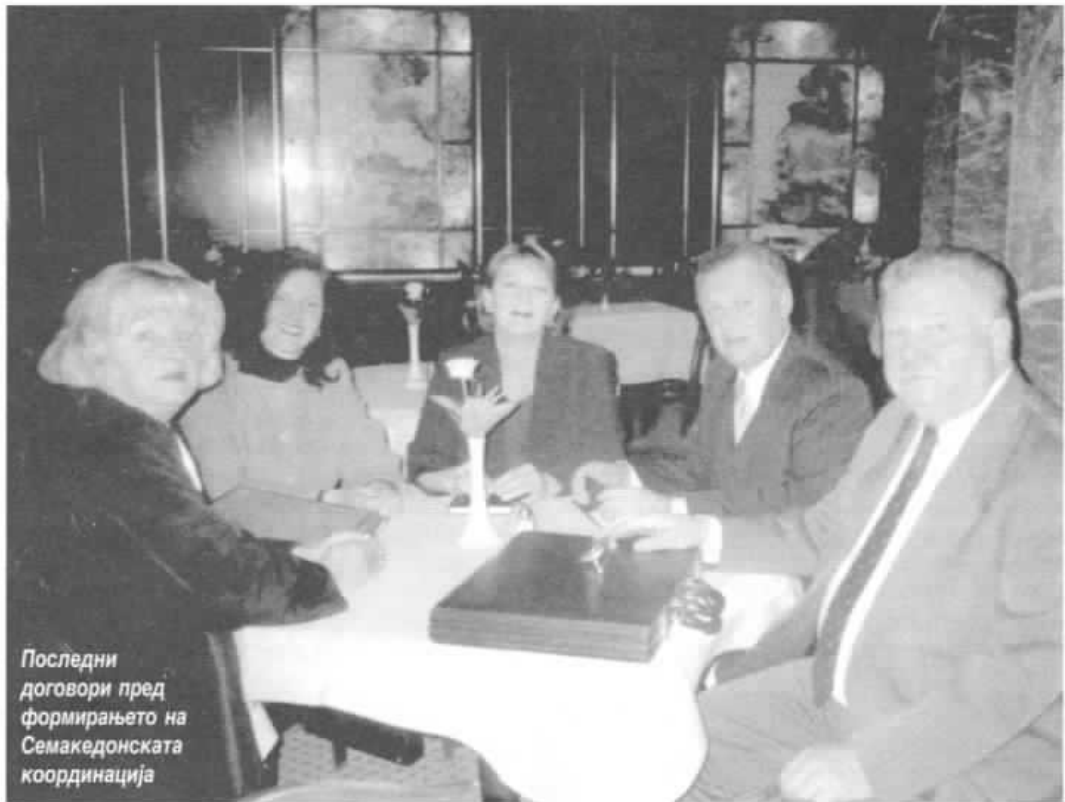
Последни договори пред формирањето на Семакедонската координација

Совет во Загреб, го покренавме прашањето за формирање на таа координација на советите на македонските национални малцинства. По половина година и заедничкото поставување на сите прашања со претседателите на советите и претставниците на нашето национално малцинство, дојдовме до заклучок дека треба да го формираме тоа тело, со кое имаме право и кое ни овозможува да ги решаваме нашите проблеми. Така се случи свеченоста во хотелот "Палас" во Загреб, на која беа потпишани спогодбите и ја формиравме Семакедонската координација во Р. Хрватска. Потписници на оваа спогодба се советите на градовите Пула, Ријека, Сплит и Загреб, кој има статус на жупанија, а кон неа пристапија и претставниците на: Приморско-горанската, Сплитско-далматинската и Истарската жупанија.