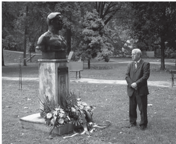
Пред њистата на Кочо Рацин

Така разбирајќи ја дипломатијата, мојата работа во оваа област ја започнав во далечната 1979 година, со преминување на работа (по 4-годишна новинарска работа во РТВ Скопје и 4-годишна работа во тогашниот Сојуз на младина на Македонија) во тогашниот Републички секретаријат за меѓународни односи на Р. Македонија. Посебно ми е задоволство што во историјата на македонската дипломатија ќе остане забележено дека сум еден од пионерите на дипломатијата на независна Република Македонија, бидејќи по формирањето на Министерството за надворешни работи на самостојна и независна Република Македонија, во почетокот на 1993 година бев меѓу првите 5 дипломати кои заминаа во странство, а меѓу дипломатите кои официјално ги отворија првите три Амбасади на независна Македонија во странство. Имено, во февруари 1993 година бев поставен