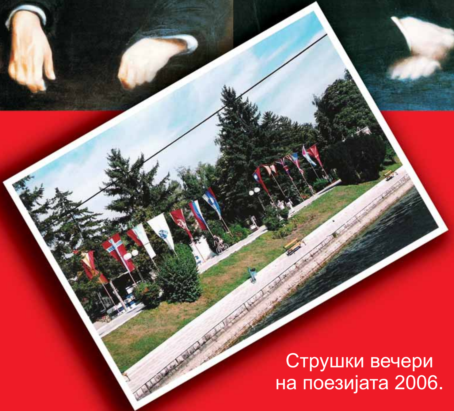
Струшки вечери на поезијата 2006.