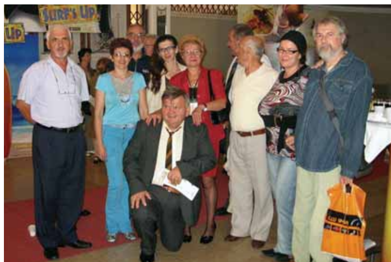
Членовите на сегашната редакција на “Македонски глас”