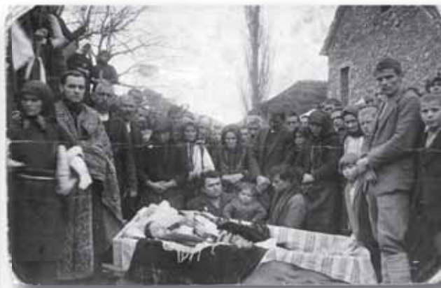
Од албумот на Милтон Манаки

дрвените скали и одиме така, од една, до друга камера, експонат и слика. Најсетне - Султанот со голема придружба на пајтон седнат се вози низ Битола. “Гледаш што сила беше, толку полиција, аскер, како никогаш порано и никој не смееше ни збор да му рече освен мене. Свртете се вака честити Султане. Така, кренете ја главата, момент останете така! И сликите беа сторени. Ти велам, ние фотографите им заповедаме и на крунисаните глави, за конзулите, да не ти зборам, ама се сеќавам и тебе те имам сликано, уште ко бебе. Ела со мене!” И тргна низ скалите се до ќералчето во дворот, под скалите, каде рошкаташе по наредените фотографски плочи и набргу ја најде. Немав ни три години, кога ме сликаше во некое плетено сиво блузиче. “Ете гледаш, по Султанот и тебе сум те сликал, а потоа дојде Уриетот, комитите и војводите одамна беа тргнале, сите сум ги сликал, дури и влегувањето на Бугарите во Битола. Ги сликав кога капитулираа и бегаа од градот, пред Германците, потоа партизаните при ослободувањето на градот!”