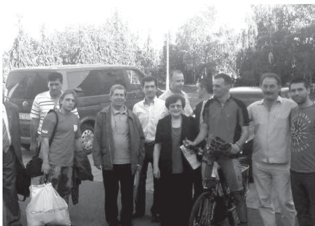
Маратонот ги посети и Македонците во Осиек