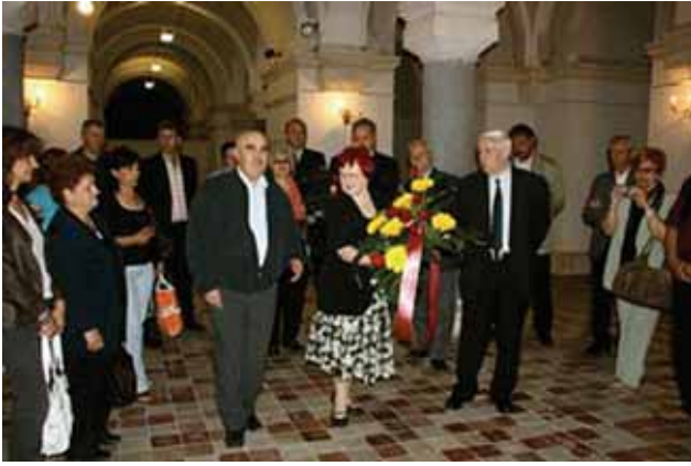
Цвеќе за почит кон Штросмаер

ње на врските меѓу Гаково и Струга, родниот град на браќата Миладиновци.