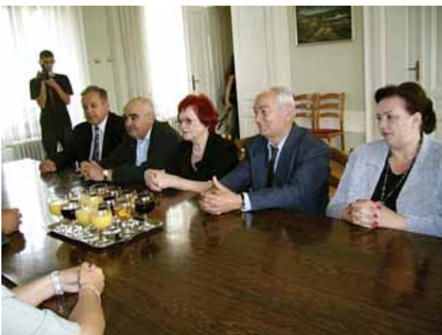
Македонската делегација на прием кај градоначалникот на Гаково