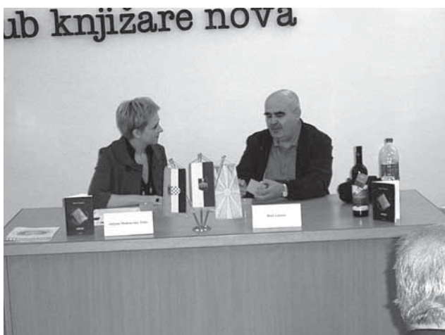
Промоција во Осиек

Во знакот на пишаниот збор и со благодарност кон струшките браќа – уште еден импозантен приказ на македонската култура