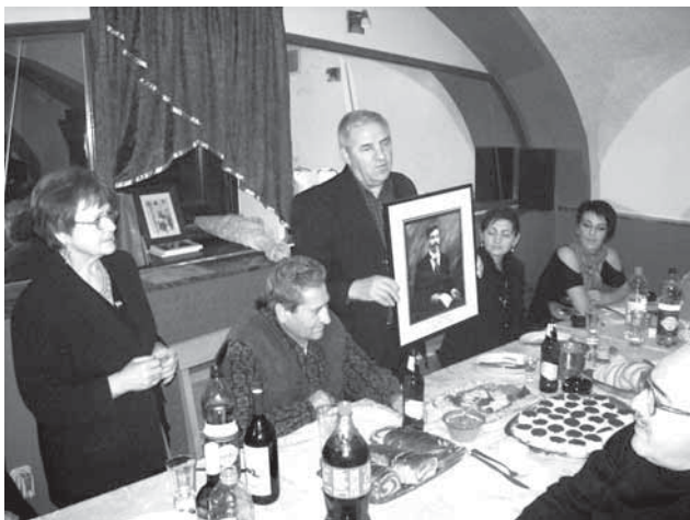
Гоцеви денови во Осиек