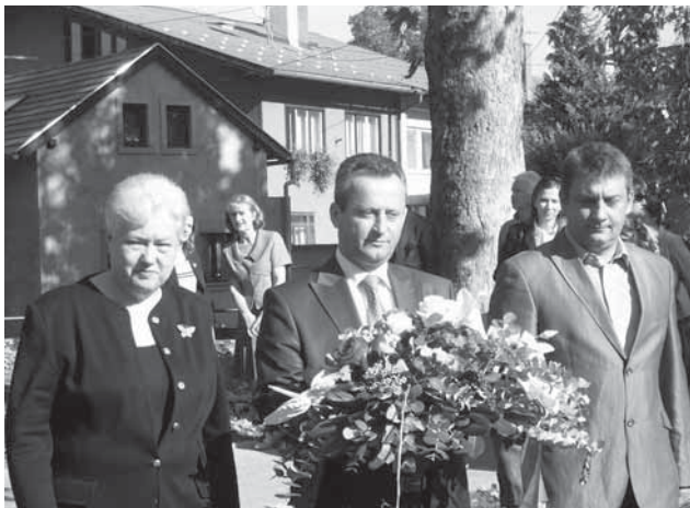
Трајко Вељаноски пред бистата на К. Рацин

При официјалната посета на Р. Хрватска, Вељаноски даде ексклузивно интервју за “Македонски глас”