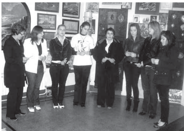
Риечка песна на Илинденките за Тоше

Членовите на фолклорната и пејачката група на МКД “Илинден” во придружба на риечкиот Фан Клуб дента го посетија Домот на деца и младеж Краљевица – Оштро. Во домот Илинденците одржаа пригодна