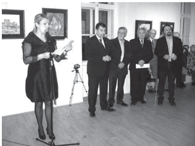
Гоцеви денови во Загреб

Од 26 до 28 октомври годинава Загреб и Осиек домаќини на манифестацијата