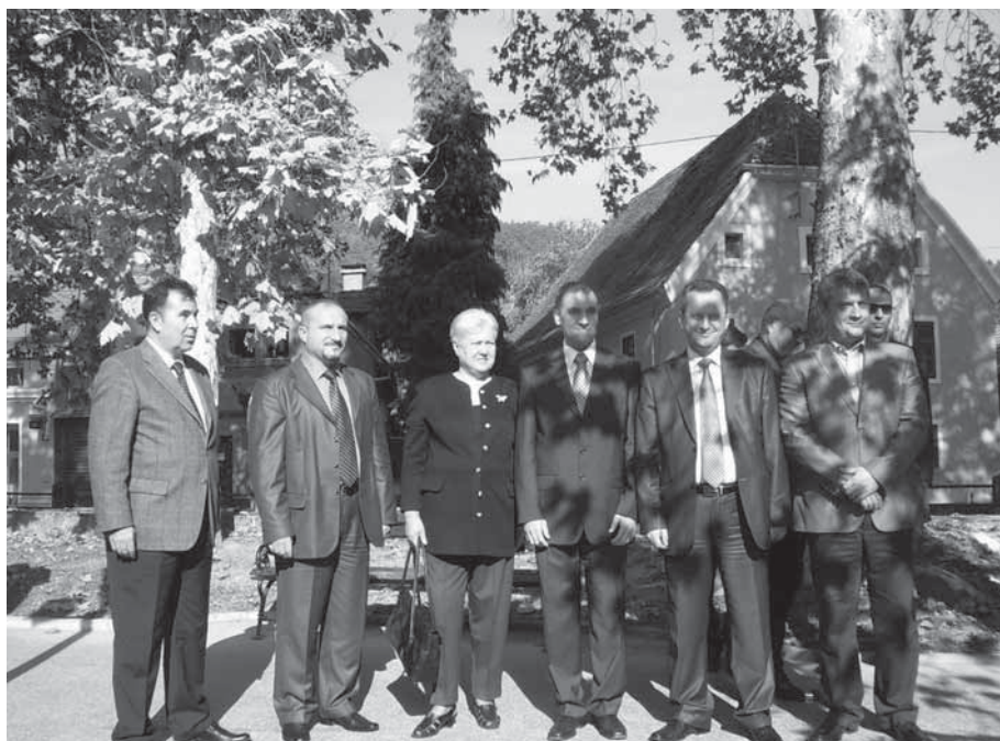
Македонските парламентарци во посета на Хрватска

Што шепотат дипломатите во своите кругови не се коментира. Сакам и сега, уште еднаш, да истакнам дека Владата на Република Македонија е подготвена преговорите со Грција да ги продолжи секако под покровителство на ОН и господинот Нимиц. Во тие преговори ние сме подготвени и за компромис, но тој компромис има своја граница, а таа црвена линија е македонскиот национален, културен и јазичен идентитет. Ниту оваа Влада ниту која било друга нема мандат оваа граница да ја помине, бидејќи тоа би значело да се откажете од идеалите на сите оние