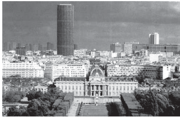
„L' Ecole militaire“ во Париз

Букурешт, каде грчката делегација изрази несогласување со името на оваа нејзина соседна република. Резултат беше што Македонија формално не стана членка на НАТО. Тоа не беше причина македонските војници да не гинат во нејзините мисии. Од каде потекнуваат овие војници и во која земја ќе ги закопаат и оплакуваат најблиските??? Треба ли Грција да ви одреди, како и нам што ни одредува, и тоа не само во овој осамен случај. Ваквата состојба се одразува со апатија и дилема на целото население, кое сè почесто ги преиспитува своите ставови кон интеграцијата, која за сега им наметнува бројни економски проблеми и изолација. Оставете на ова чувствително подрачје “сиви зони” кои стануваат видни цели на многу аспирации и шпекулации. Погрижете се сината европска боја сите да не соедини!”