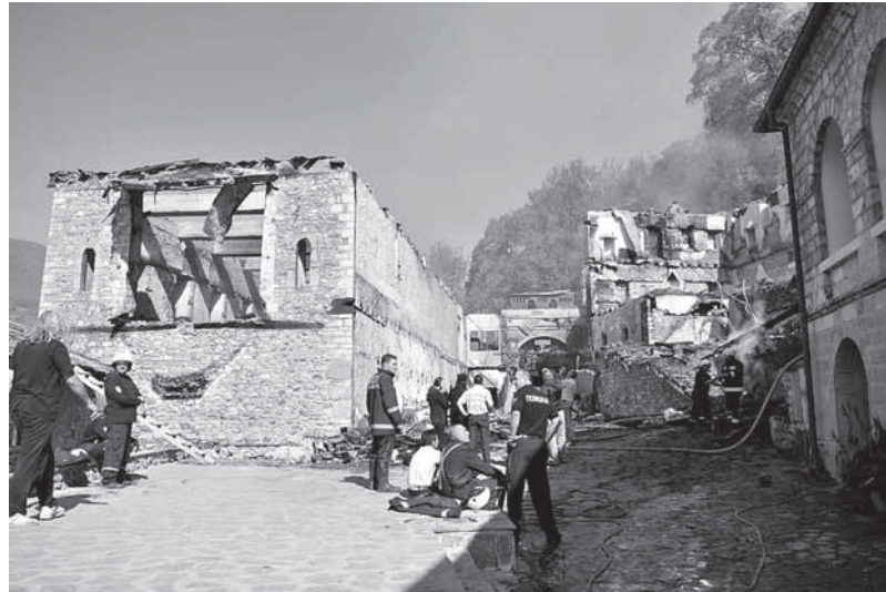
... и по катастрофалниот пожар