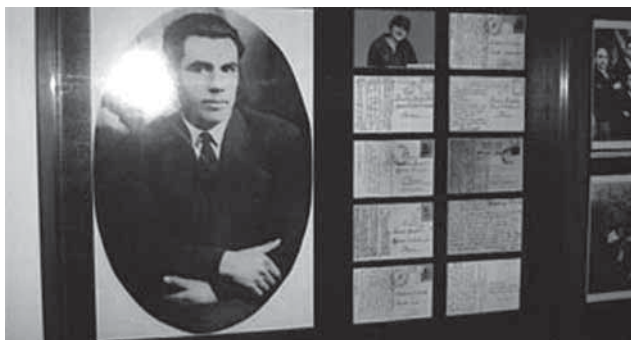
Спомен-домот на Кочо Рацин во Велес

ВЕЛЕС- Промоција на репринтот на Рациновите “Бели мугри” во чест на одбележувањето на стогодишнината од раѓањето на поетот и седум децении од нејзиното излегување од печат, завчера вечер се случи во родниот град на поетот, Велес.