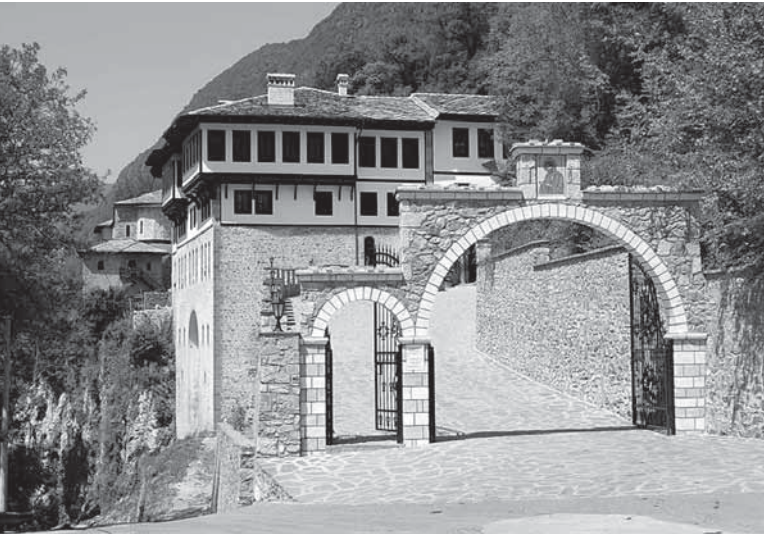
Бигорскиот манастир пред ...

“.. Јас првпат дојдов пред портите на рајот и рајот во тебе го видов...” – Тодор Чаловски