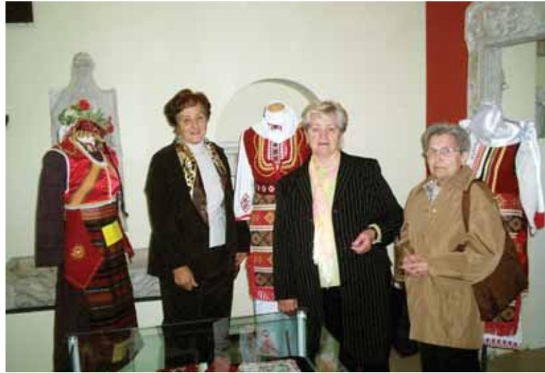
Дел од изложените етно експонати на изложбата