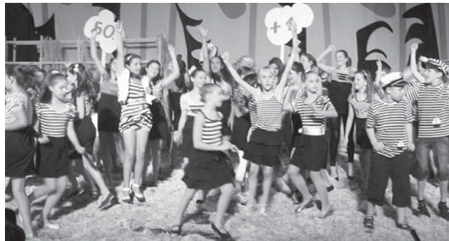
Хорот “Здраво малени” на отворањето на Фестивалот

На годишното 51. издание на реномираната и потврдена хрватска манифестација Меѓународ- ниот фестивал на детето се претставил и маке- донски уметници од Македонската опера и балет, како и од Баскер фест од Скопје, кој со години на- назад ги полни шибенските плоштади и улици