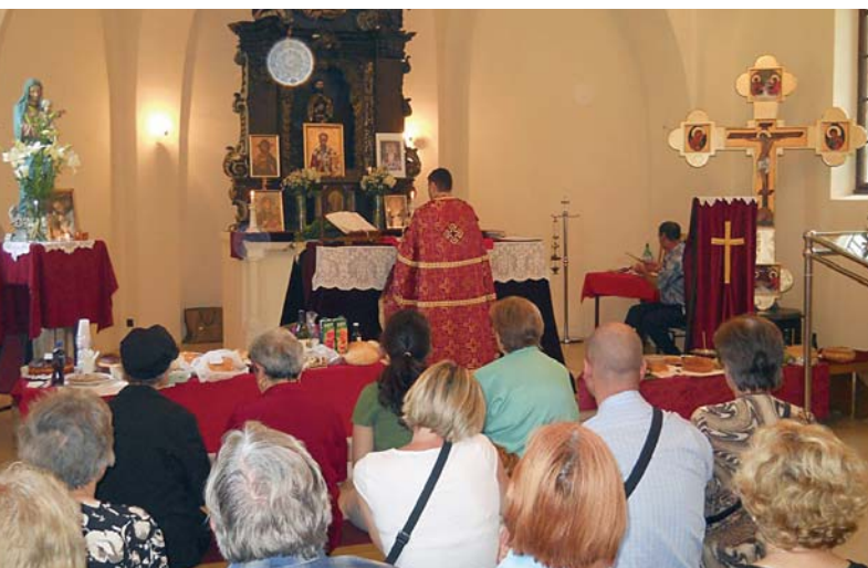
Парастос за Миладиновци во Загреб

Манифестацијата се одржа во знак на големиот роденден 150-годишнината од објавувањето на Зборникот на струшките браќа