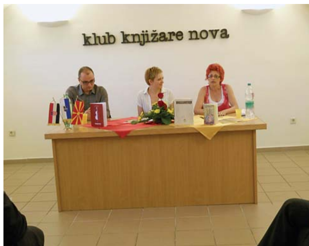
Претставување на наградените поети во Осиек

Традиционално, Друштвото оваа манифестација им ја подарува на двата града, Осиек и Гаково, но годинава, манифестацијата ги опфати и градовите Загреб и Струга! Така, сè започна со Загреб кога на 2 јуни се одржа тркалезната маса “Денови на Димитар и Константин Миладинов”, богата со бројни излагачи и гости и организирана од страна на Македонската амбасада во Загреб, а на иницијатива на МКД “Браќа Миладиновци”. Една недела подоцна, на 12 јуни беше одржан парастос за браќата Миладиновци во црквата “Св. Рок” кој го предводеше протојерејот