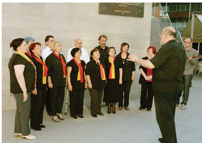
„Вардарки“ на местото на родната куќа на Штросмаер