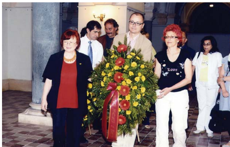
Полагање венци на гробот на Штросмаер