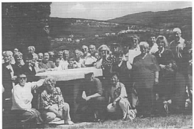
Sa izleta u Humu - Roč, Avenija Glagoljaša, kod kamenog stola posvećenog Sv. Braći Kirilu i Metodu, članovi i aktivisti MKD »Kočo Racin« - Pula