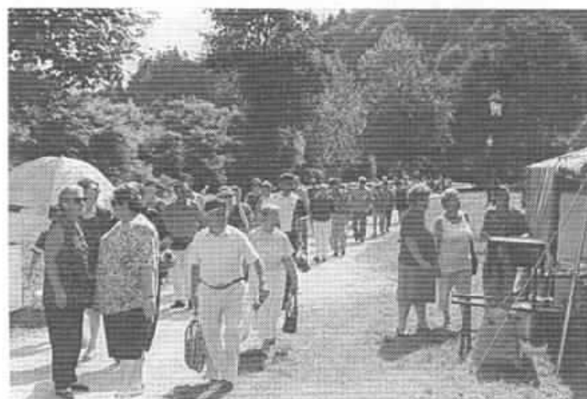
Излетничката колона Македонци и нивни пријатели и гости пристигнува во излетиштето Вугриншчак на традиционалниот Илинденски пикник