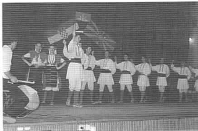
Plesačice i plesači "Dame Grueva" izvode igru "povardarje", koju su gledatelji burno pozdravili

Gostovanje AKUD "Dame Gruev" iz Bitole u Splitu