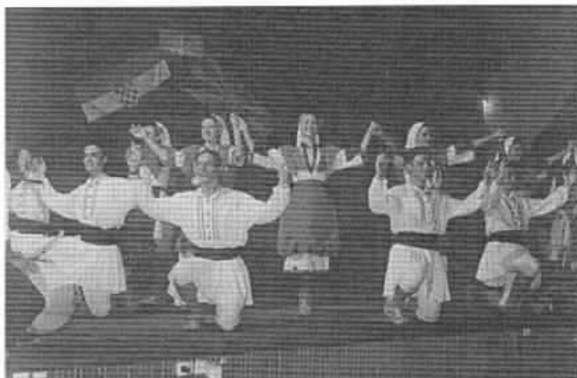
Oro "teškoto", jedna od najimpresivnijih točaka "gruevaca" u Splitu.