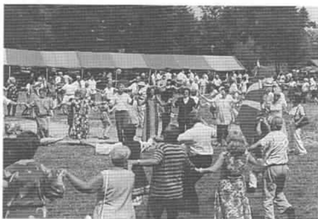
Орото не е само радост и веселба, тоа е и воздишка на секој заигран на овој пикник, од Пула, Риека, Осиек, Сплит или Загреб