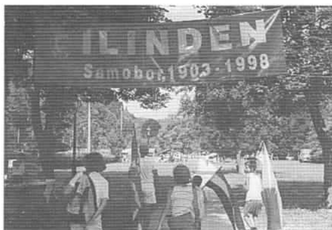
Добре дојдедовте на петтиот по ред и традиционален Илинденски пикник во Самобор — убаво геста на домаќините од Загреб