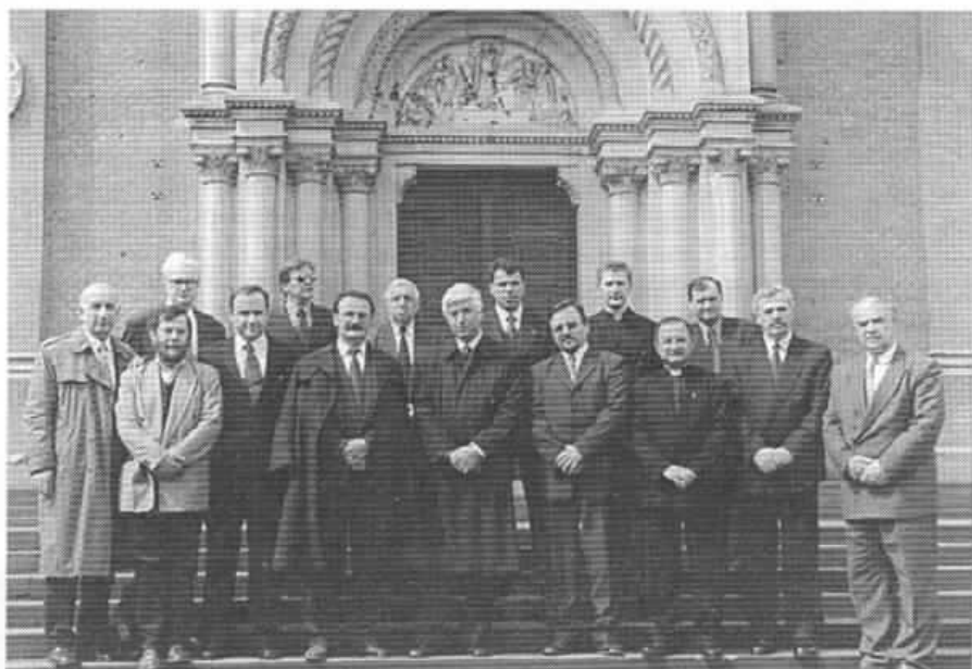
Пред Ѓаковечката катедрала, каде што се наоѓа вечниот дома на бискупот Штросмаер, македонската делегација со домаќините ја овековечува оваа одамна прижелкувана посета и воспоставениот мост меѓу Ѓаково и Струга