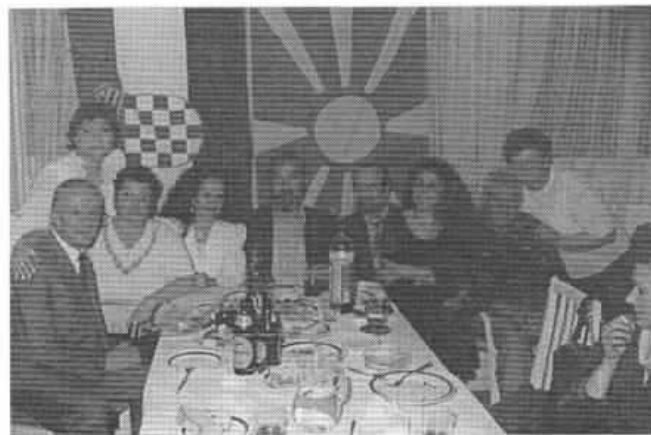
Македонските христијани во Сплит ги негуваат своите национални и верски традиции не само во семејствата туку и заедно на средбите и веселбите