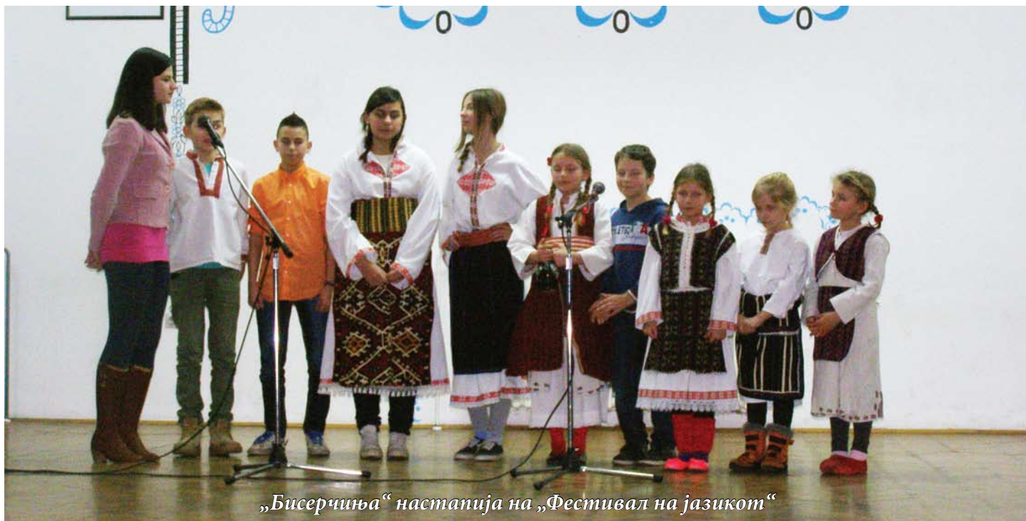
„Бисерчиња“ настапија на „Фестивал на јазикот“