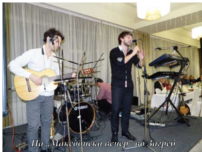
На „Македонска вечер“ во Загреб