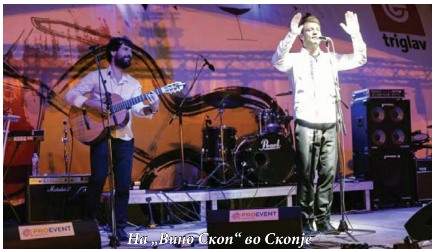
На „Вино Скоп“ во Скопје