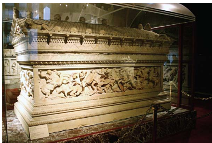
Копијата на саркофагот на Александар Македонски