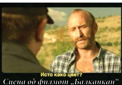
Исто како цвет? Сцена од филмот „Балканкан“

Риека - Во традиционалните Денови на македонската култура во Риека на 25 ноември се одржа вечер на македонскиот филм. Воведен збор имаше проф. Васил