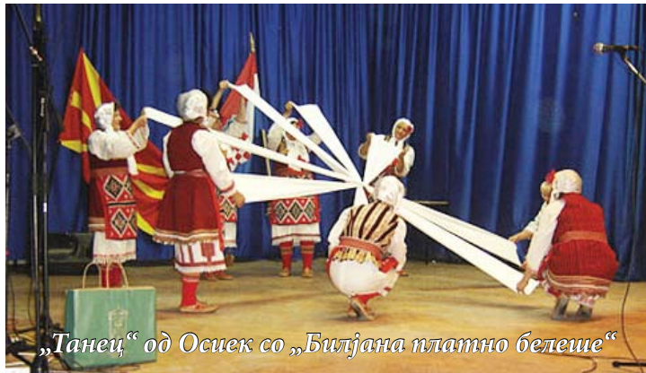
„Танец“ од Осиек со „Билјана платно белеше“