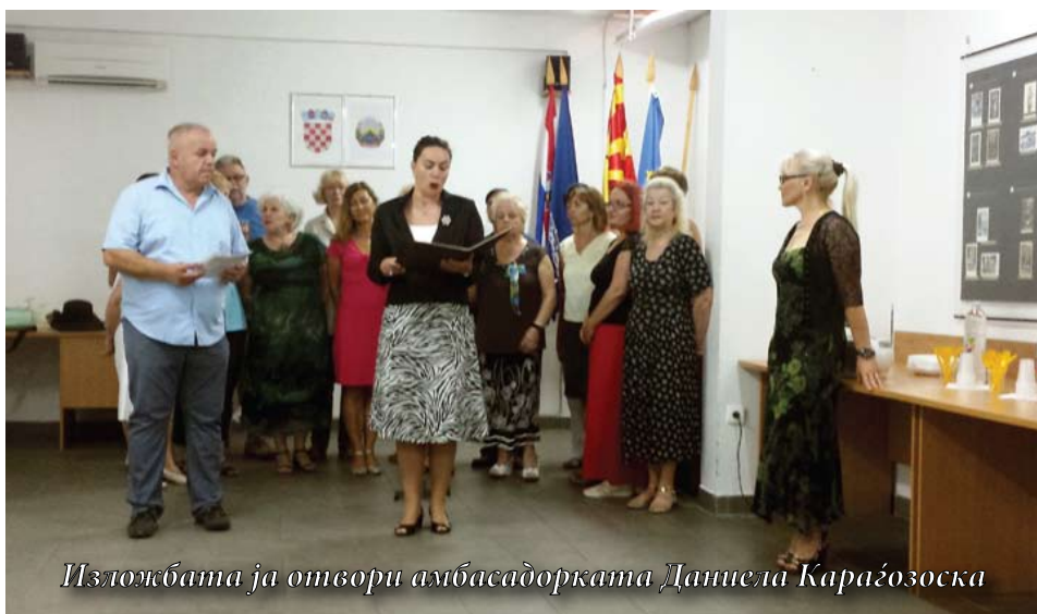
Изложбата ја отвори амбасадорката Даниела Караѓозоска