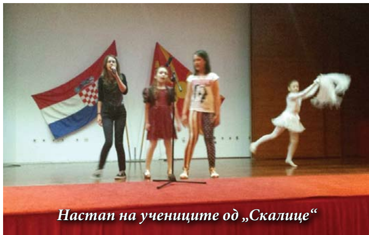
Настап на учениците од „Скалице“