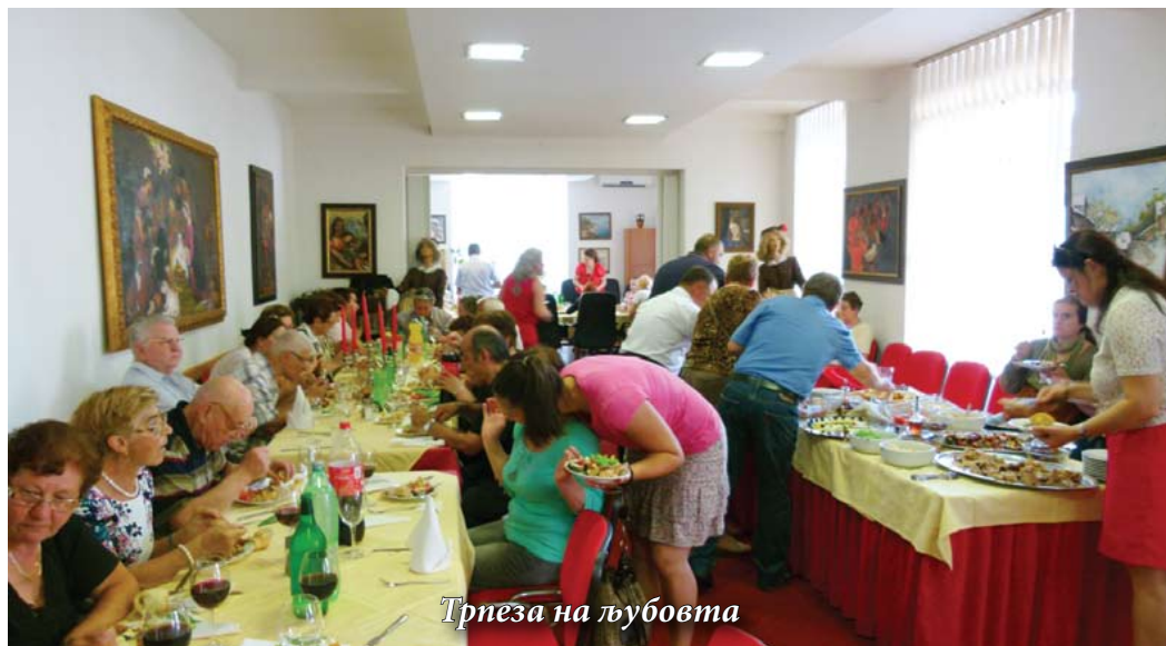
Трпеза на љубовта