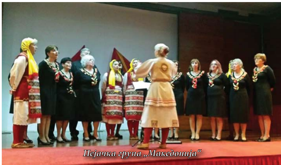
Пејачка група „Македонија“

Годинешните Денови на македонската култура – Денови на Св. Кирил и Методиј во Сплит се одржаа по 24. пат и тоа со бројни активности