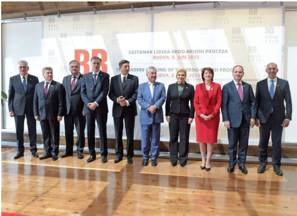
Поддршка за Македонија од државите од регионот

Во Будва, на состанокот на Претседателскиот процес Брдо-Бриони, со особено задоволство беше прифатена и поздравена иницијативата на хрватската претседателка Колинда Грабар-Китаровиќ, таа и нејзиниот словенечки колега, Борут Пахор да го посетат Скопје со цел да придонесат во напорите за надминување на моменталната политичка криза во земјата