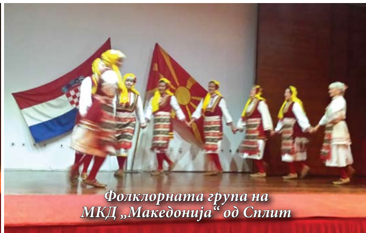
Фолклорната група на МКД „Македонија“ од Сплит