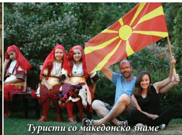
Туристи со македонско знаме

лот од многу краеве од Р. Хрватска и од соседните држави, за прв пат се слушнаа и нашата македонска песна, оро и поезија.