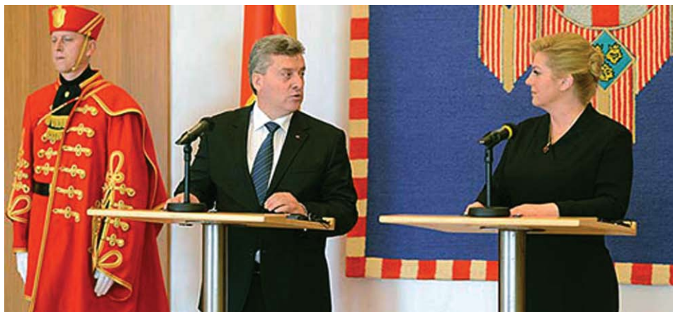
Трета официјална посета на македонскиот претседател Ѓорге Иванов на Република Хрватска

Без Македонија во Европската унија и НАТО, останува недовршена работата во Југоисточна Европа, бидејќи нашиот цел простор природно припаѓа на евроатлантските интеграции“.