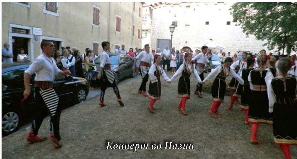
Концерт во Пазин

Друштвата зедоа учество и на фестивалот „Традин етно“ во Пазин на 17 јули. Меѓу многубројните учесници на фестива-