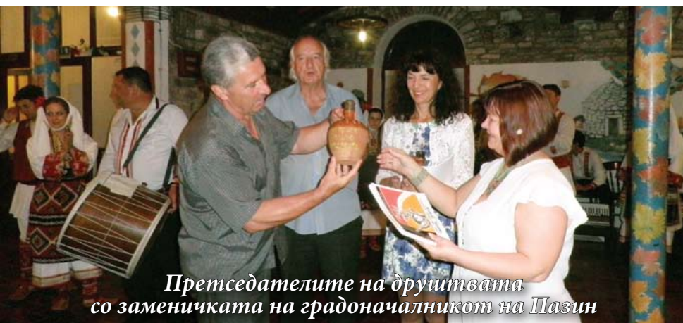
Претседателите на друштвата со заменичката на градоначалникот на Пазин