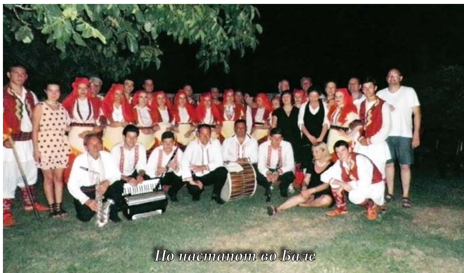
По настанот во Бале

„Деновите на македонската култура во Истра“ продолжија, како и секоја година со одржување на концерти во повеќе градови на Истра