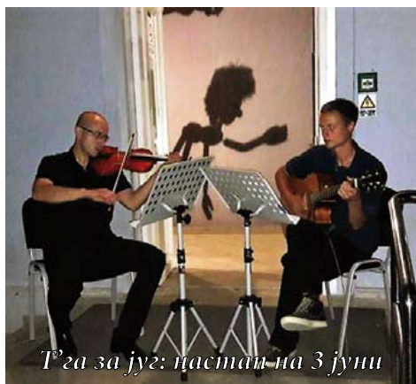
Т'га за југ: настап на 3 јуни

Нови матрици на македонски песни: инструменталистите на секцијата Т'га за југ во овој период направија пет матрици на македонски песни за придружба на Вардарки . Труд вреден за секоја пофалба! Име-