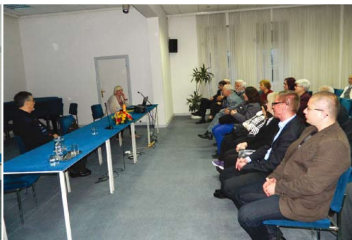
Станете да се ослободиме: Слобода или смрт

Во организација на Советот на македонското национално малцинство за Град Загреб, на 12 и 13 мај 2016 година во салата на Трибината на Град Загреб, се одржаа две историски трибини за македонското национално ослободително движење – процес на културно, национално, државно-политичко будење и осамостојување на македонскиот народ.