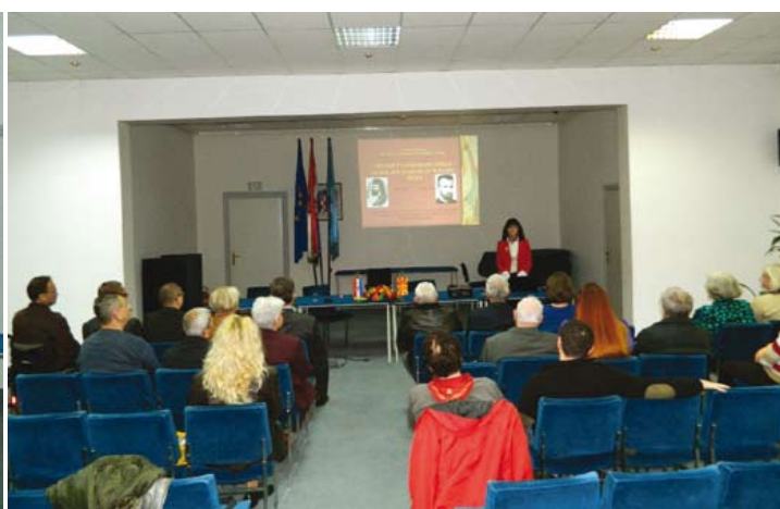
Милоста кон народниот јазик е наш долг и наше право