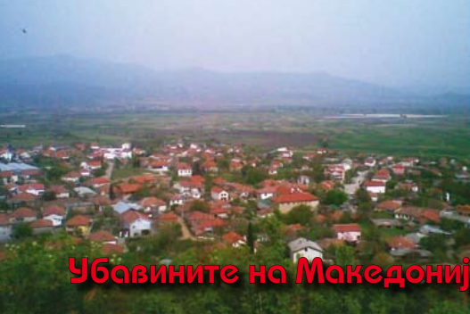
Убавините на Македонија