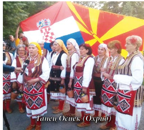
Танец Осиек (Охрид)