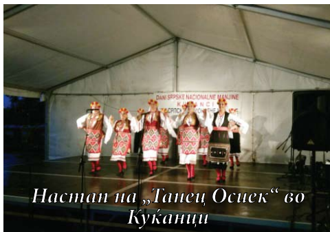
Настап на „Танец Осиек“ во Куќанци