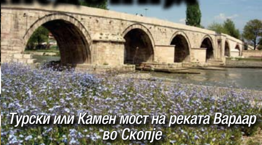
Турски или Камен мост на реката Вардар во Скопје