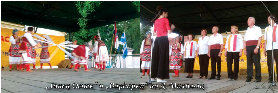
„Танец Осиек“ и „Вардарки“ во Д. Михољац

Во лето членките и членовите на МКД „Браќа Миладиновци“ од Осиек не мируваа: и во јули и во август беа зафатени со гостувања и настапи од кои ќе ги издвоиме настапите во Доњи Михољац, Куќанци, Чепински Мартинци и Пишкоревци.