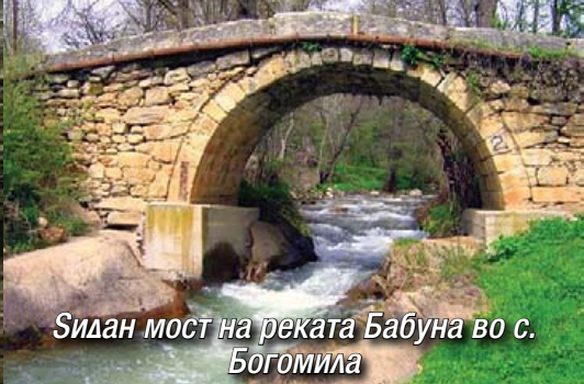
Сидан мост на реката Бабуна во с. Богомила