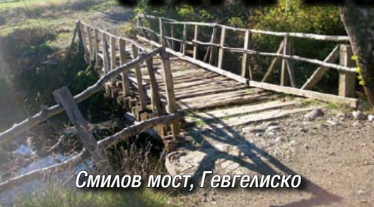
Смилов мост, Гевгелиско