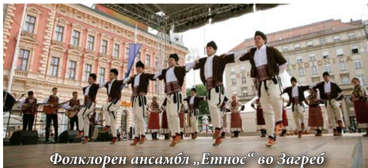
Фолклорен ансамбл „Етнос“ во Загреб