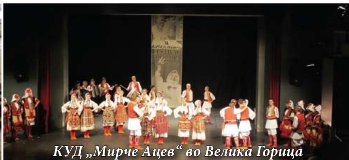
КУД „Мирче Ацев“ во Велика Горица

Оваа година загребската Меѓународна смотра на фолклор ја одбележи својата јубилејна 50-годишнина, а како е ова еден од најстарите фестивали по својата традиција, прогласен е за хрватски национален фестивал. Посетителите имаа можност од 20 до 24 јули на неколку локации во Загреб да ги проследат настапите на бројни фолклорни друштва и поединци кои ја претставуваа разновидноста на хрватското етнографско наследство, како и претставници на националните малцинства кои го претставуваа народното богатство на своите народи и култури.