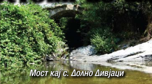
Мост кај с. Долно Дивјаци