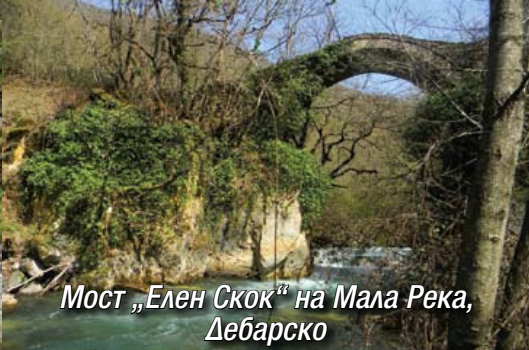
Мост „Елен Скок“ на Мала Река, Дебарско