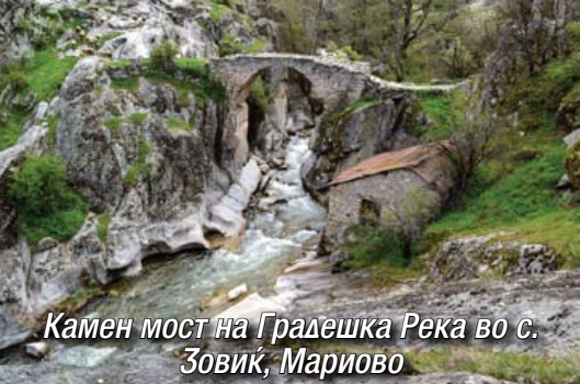
Камен мост на Градешка Река во с. Зовик, Мариово