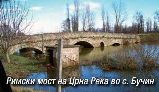
Римски мост на Црна Река во с. Бучин