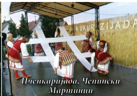
Пченкаријада, Чепински Мартинци