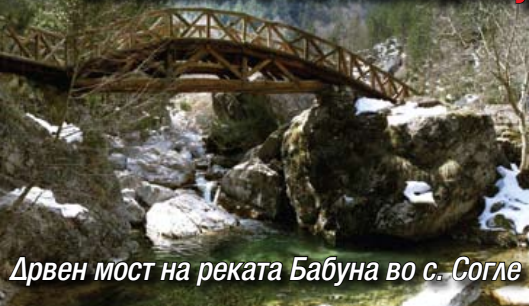
Дрвен мост на реката Бабуна во с. Согле