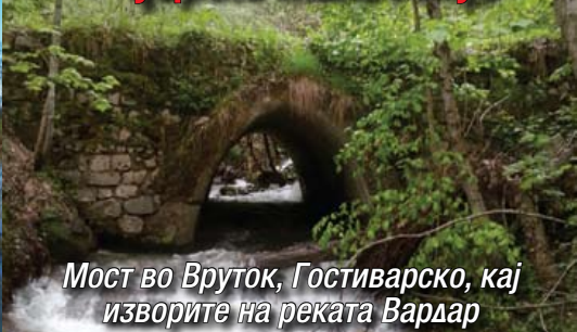
Мост во Вруток, Гостиварско, кај изворите на реката Вардар