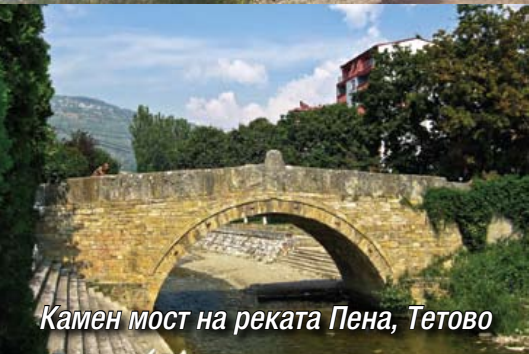
Камен мост на реката Пена, Тетово