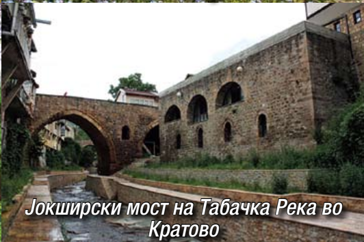
Јокширски мост на Табачка Река во Кратово

Градењето на мостови започнало уште многу одамна за да се овозможи премостување на природните и вештачките препреки и преминување на луѓето. Првите мостови биле дрвени, а потоа се граделе од камен и од метални конструкции. Особено во турскиот период во Македонија била мошне развиена изградбата на мостови кои претставувале значаен фактор на патиштата за непречено движење на карваните.