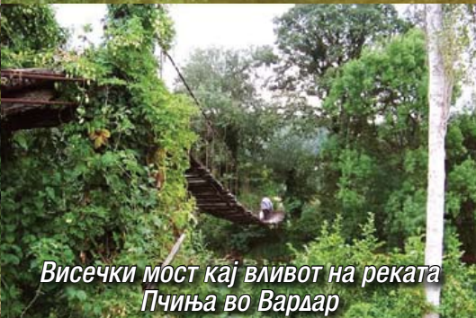
Висечки мост кај вливот на реката Пчиња во Вардар