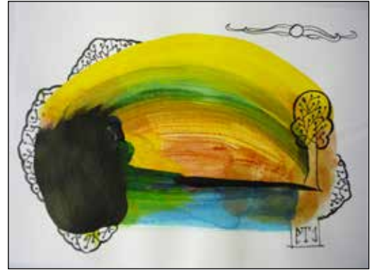
21. STOJČE TOCINOVSKI Kompozicija, kombinirana tehnika