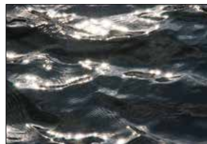
17. SENKO SORIĆ "Zrcali se more", foto-kompozicija