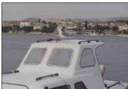
10. ŽAKLINA KUTIJA "Odmor", foto-kompozicija