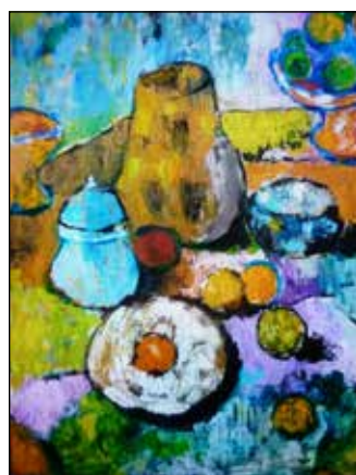
14. NEVEN OTAVIJEVIĆ "Živa priroda", ulje-platno