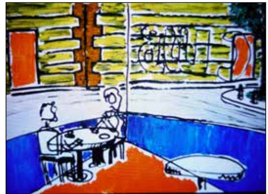
23. RADE ZRILIĆ "Interjer - Osijek", ulje-platno