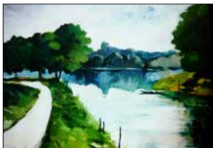
16. PAVLE SAMEK "Studija prirode", ulje-platno