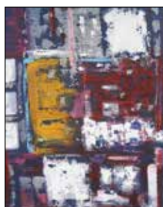
2. SNJEŽANA BENCARIĆ Apstraktna kompozicija, komb. tehnika