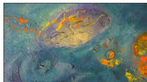
15. NEBOJŠA RUŽIĆ VARDA Apstraktna kompozicija, ulje-platno