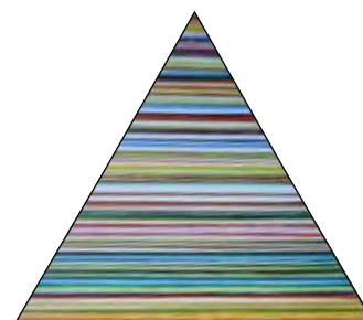
3. MILAN CIGLAR OP - ART kompozicija, ulje-platno