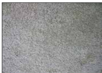
1. BRANKO ANTUNOVIĆ "Teksture", foto - kompozicija