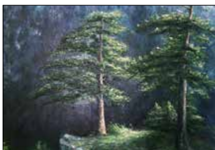
13. SILVANA MIHALJEVIĆ "Proplanak", ulje-platno