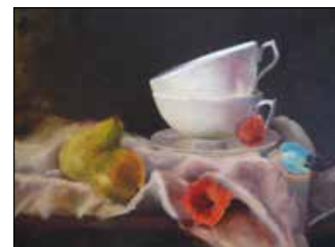
6. KRISTINA JORDAN "Still life", ulje-platno