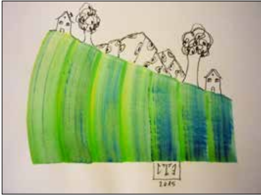
20. EMILIJA TOCINOVSKI Kompozicija, kombinirana tehnika