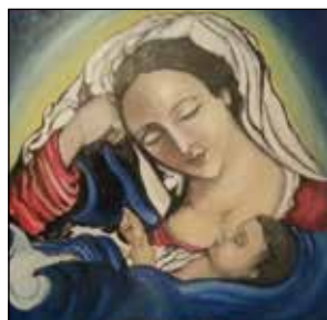
4. IVA ČAČIĆ "Radost svijeta", ulje-platno