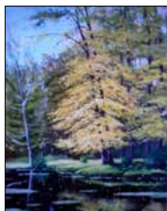
8. DAMIR KAMENAR "Jesen", ulje-platno