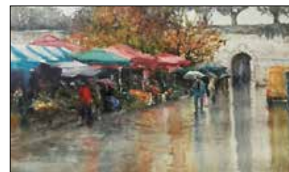
9. TOMISLAV KOŠTA "Jesen na pijaci", akvarel