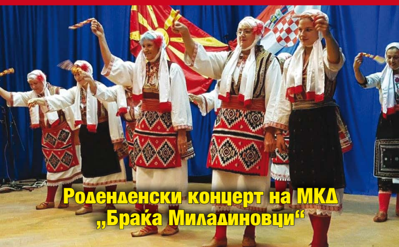
Роденденски концерт на МКД „Браќа Миладиновци“