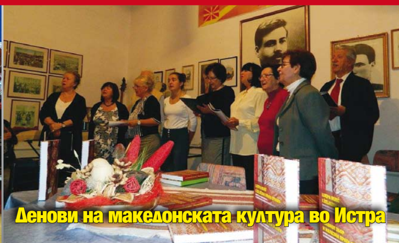
Денови на македонската култура во Истра

БЛАГОСЛОВЕН БОЖИК И СРЕКНА НОВА 2017 ГОДИНА