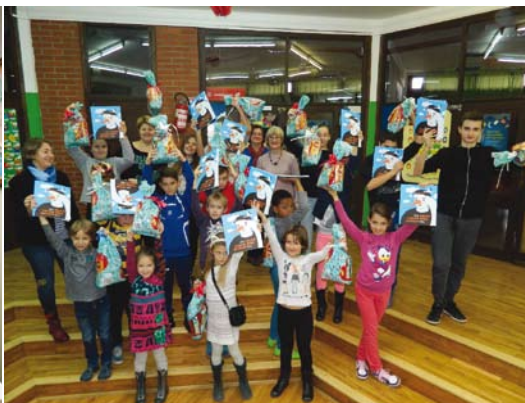
ОУ „Никола Тесла“

На 2 декември 2016 година членовите на претседателството на Советот со подароци, слатки и книгата Силјан штркот , ги изненадија и развеселија учениците од ОУ „Аугуст Харамба-