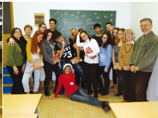
Прва гимназија во Загреб

Средношколците од Првата гимназија во Загреб, на 17 декември Советот ги даруваше со чоколади и со книгата крат-