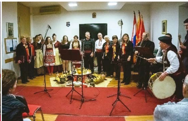
Вечер на македонска песна

лијанците од Каштелир, Истра, „Нигригнанум“.