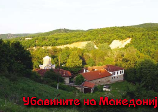
Убавините на Македонија