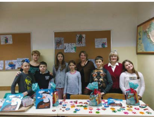
ОУ „Аугуст Харамбашиќ“

Во пресрет на божиќните и новогодишните празници, традиционално како и секоја година, од страна на Советот на македонското национално малцинство за Град Загреб, на учениците кои ја посетуваат изборната настава по македонски јазик и култура по моделот Ц во Загреб, им беа доделени новогодишни пакетчиња.