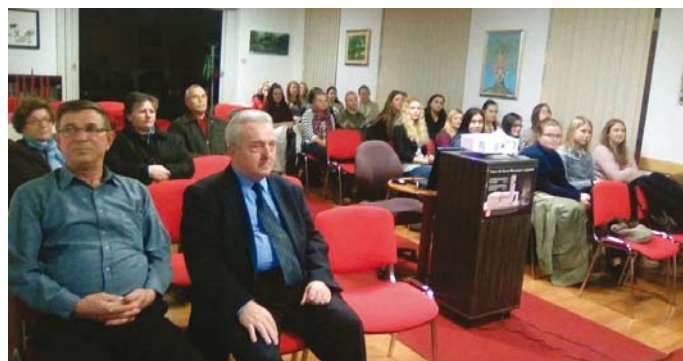
Проекција на филмот „Пред дождот“