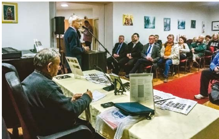
Пријатели на книгата

Традиционалните „Денови на македонската култура“ во Риека (19.11-17.12.2016 г.), организирани од МКД „Илинден“, и оваа година го означуваат одбројувањето на последните шест недели од 2016 година. Одбројувањето започна со уште една одлична соработка меѓу македонското културно друштво и Хрватското книжевно друштво, огранок Риека, а продолжи во знакот на Денот за борба против насилството врз жената, преку македонската етно-изложба и гастрономија, македонската песна и филм и заврши во знакот на најмладите