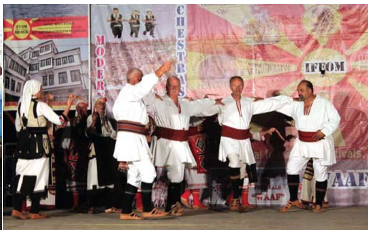
Настап на ИФФОМ во Охрид