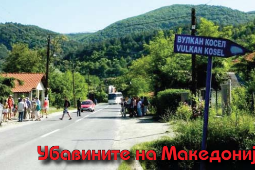
Убавините на Македонија