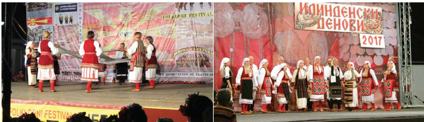
Илинденски денови, Битола

МКД „Браќа Миладиновци“ организираше пат и настап на членовите на Друштвото на две значајни манифестации во родната Македонија. Но на пат не отидовме сами: со нас беа и нашите пријатели од унгарското КУД „Петефи Шандор“ од Ласлово. Заедно ги посетивме Охрид, Битола и Струга