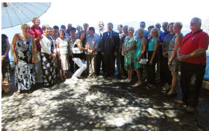
Со претседателот на РМ, Ѓорге Иванов