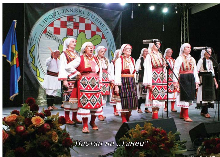
Настап на „Танец“

Гредишната културна манифестација на националните малцинства на Република Хрватска, Липовљанските средби, на 26 август свечено ја отворија со песна, танци и претставување на своите обичаи десет друштва од цела Хрватска, меѓу кои како претставници на македонските обичаи и култура беше МКД „Браќа Миладиновци“ од Осиек.